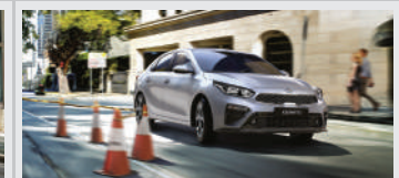
Sistema de Freno Antibloqueo (ABS)