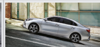
Control de Asistencia al Arranque en Pendientes (HAC)