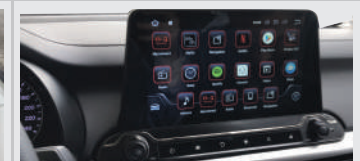
Sistema de entretenimiento Kuvic con pantalla de 8 pulgadas