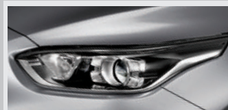
Luces de conducción diurna LED